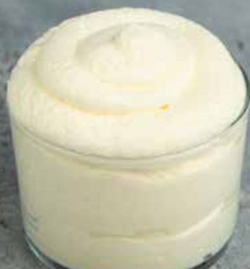
FOND ROYAL CL HVID CHOKOLADE