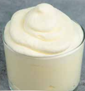
FOND ROYAL CL NEUTRAL