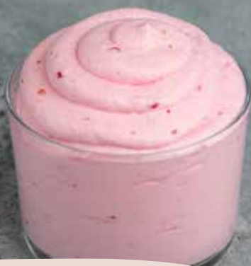
FOND ROYAL CL HINDBÆR