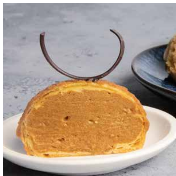
Craquelin med KONDITORIPASTA LATTE MACCHIATO Flødecreme med GOLDEN-DELIKATESSE-CREME, smagsat med KONDITORIPASTA LATTE MACCHIATO

Tilsæt konditoripasta og skab din egen smagsvariant!