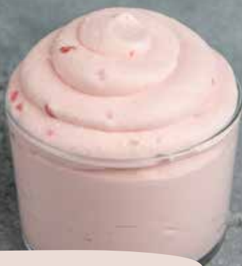
FOND ROYAL CL JORDBÆR